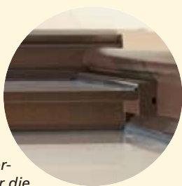
Winterblende für die kalten Monate

Zusätzlich kann die Öffnung optional mit einem Insektenschutz oder einer Winterblende ausgerüstet werden.