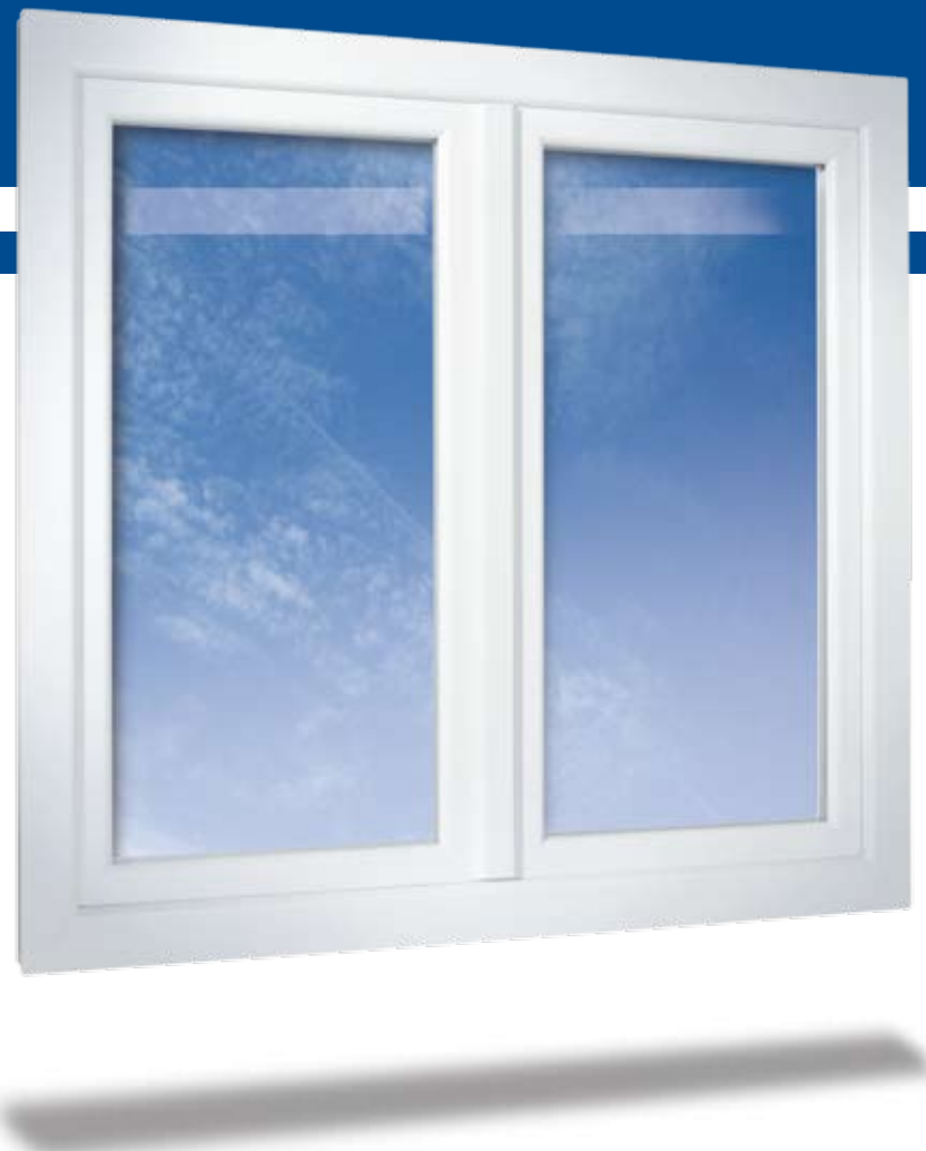
2-flügeliges Fenster in flächenversetzter Variante