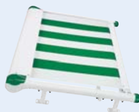
Flachanlage WGM 1030

Für größere Flächen können bis zu vier WGM 1030 nebeneinander montiert werden. Die Tücher fahren parallel ein und aus. Ab einer bestimmten Breite werden zwei durch einen Motor betriebene Einzelanlagen mit Hilfe eines Doppeltransportprofils verbunden.