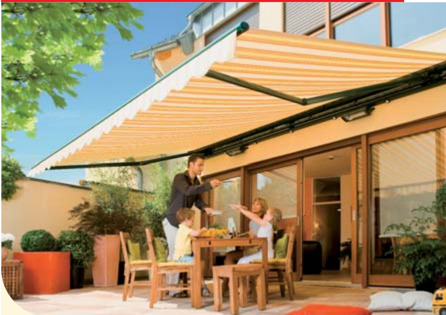
▲ weinor Markisen