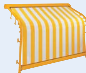
Bogenanlage WGM 2020 Design