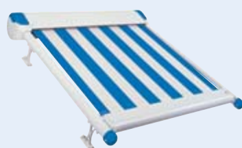
Flächenanlage WGM 2030 Design

Alternativ können Sie eine WGM 2030 Design in Kombination mit der Fenster-Markise Aruba wählen. In diesem Fall werden Dachschräge und Seitenelemente unabhängig voneinander beschattet – natürlich ist beides mit der Fernbedienung zu steuern. Diese Lösung eignet sich besonders für kleinere Wintergärten.