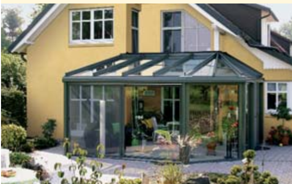
▲ weinor Wintergärten

Wie auch immer Sie Ihre Terrasse nutzen möchten, weinor hat das geeignete Produkt für Sie – Markise, Terrassendach, Glasoase® und Wintergarten